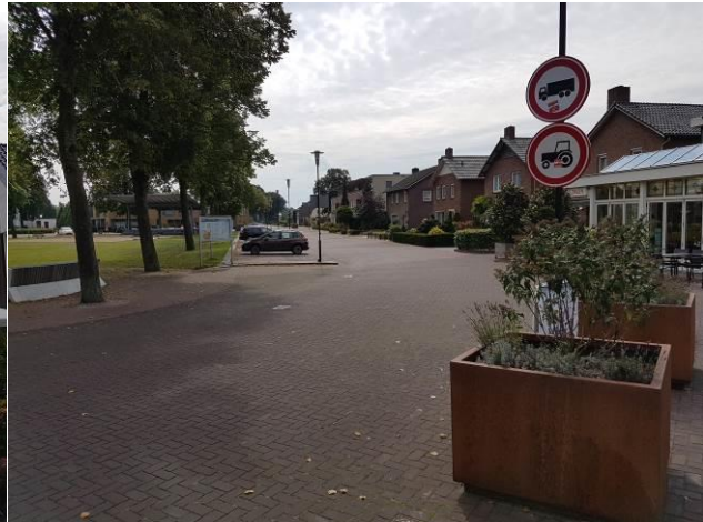
Inrijverboden bij oprijden.